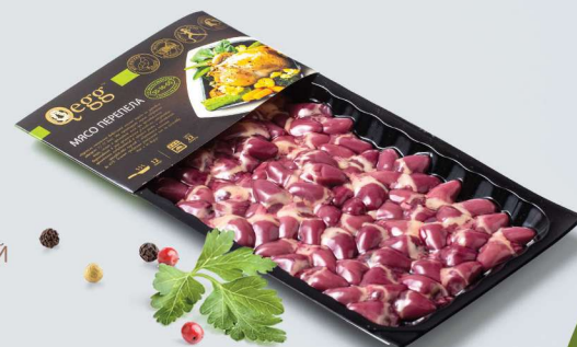
СЕРДЦЕ ПЕРЕПЕЛИНОЕ «DARFRESH» QUAIL HEARTS «DARFRESH»

Shelf life and storage conditions: Chilled. At a temperature of 0°C to +2°C and relative humidity 80-85% no more than 10 days. Freezing. At a temperature of -18°C no more 6 months.