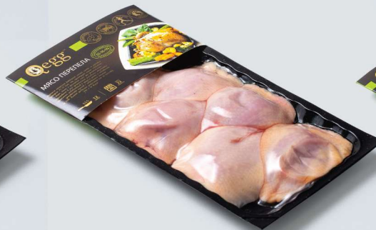
ГРУДКА ИЗ МЯСА ПЕРЕПЕЛОВ «DARFRESH» BREAST OF QUAIL MEAT «DARFRESH»

Shelf life and storage conditions: Chilled. At a temperature of 0°C to +2°C and relative humidity 80-85% no more than 10 days. Freezing. At a temperature of -18°C no more 6 months.