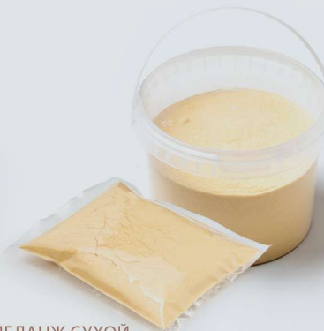
МЕЛАНЖ СУХОЙ ИЗ ПЕРЕПЕЛИНОГО ЯЙЦА MELANGE DRY QUAIL EGG

Shelf life and storage conditions: at temperatures from 0°C to +6°C and relative humidity no more than 75-80% no more than 20 days.