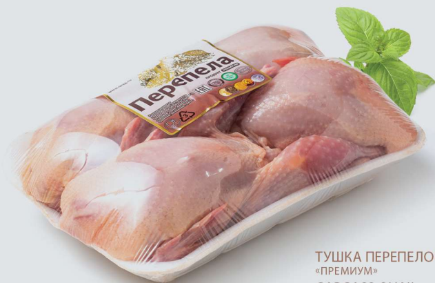
ТУШКА ПЕРЕПЕЛОВ «ПРЕМИУМ» CARCASS QUAIL «PREMIUM»

Срок годности и условия хранения: Заморозка. При температуре -18°C не более 12 месяцев.