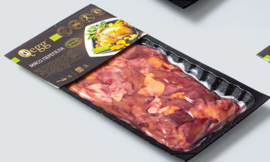
ПЕЧЕНЬ ПЕРЕПЕЛИНАЯ «DARFRESH» QUAIL LIVER «DARFRESH»

Shelf life and storage conditions: Chilled. At a temperature of 0°C to +2°C and relative humidity 80-85% no more than 10 days. Freezing. At a temperature of -18°C no more 6 months.