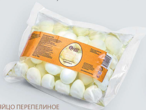
ЯЙЦО ПЕРЕПЕЛИНОЕ В МАРИНАДЕ (ПАКЕТ) QUAIL EGG IN MARINADE (PACKAGE)

Shelf life and storage conditions: at temperatures from 0°C to +10°C and relative humidity no more than 75% no more than 180 days.