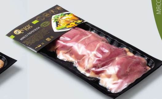
МЯСО ПЕРЕПЕЛА ДЛЯ ЖАРКОГО БЕСКОСТНОЕ «DARFRESH» NATURAL QUAIL MEAT BONELESS «DARFRESH»

Shelf life and storage conditions: Chilled. At a temperature of 0°C to +2°C and relative humidity 80-85% no more than 10 days. Freezing. At a temperature of -18°C no more 6 months.