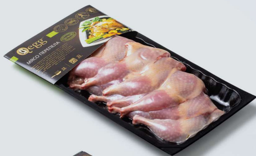
ЧЕТВЕРТИНА (ЗАДНЯЯ) ИЗ МЯСА ПЕРЕПЕЛОВ «DARFRESH» QUAIL LEG «DARFRESH»

«DARFRESH» – ИННОВАЦИОННАЯ ВАКУУМНАЯ УПАКОВКА, ОБЕСПЕЧИВАЮЩАЯ ГЕРМЕТИЧНУЮ ИЗОЛЯЦИЮ, СПОСОБСТВУЮЩУЮ ДЛИТЕЛЬНОМУ СОХРАНЕНИЮ КАЧЕСТВА ПРОДУКТА. ПРОДУКЦИЯ В УПАКОВКЕ «DARFRESH» – ЭТО ИЗЫСКАННЫЙ ВКУС, ПРИВЛЕКАТЕЛЬНЫЙ ВНЕШНИЙ ВИД И УНИКАЛЬНЫЕ ТЕХНОЛОГИИ БЕЗ ПРИМЕНЕНИЯ КОНСЕРВАНТОВ!