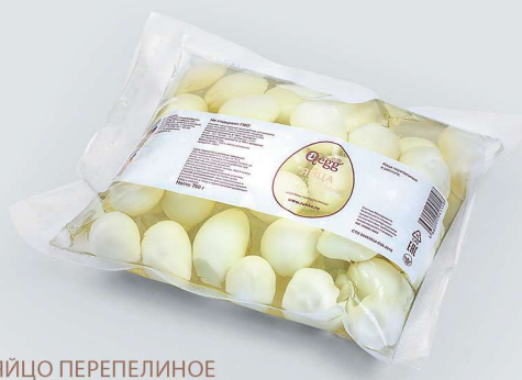
ЯЙЦО ПЕРЕПЕЛИНОЕ В РАССОЛЕ (ПАКЕТ) QUAIL EGG IN BRINE (PACKAGE)

Shelf life and storage conditions: at temperatures from 0°C to +6°C and relative humidity no more than 75-80% no more than 30 days.