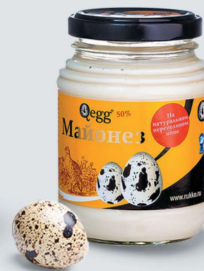
МАЙОНЕЗ КЛАССИЧЕСКИЙ MAYONNAISE CLASSIC

Shelf life and storage conditions: at temperatures from 0°C to +10°C and relative humidity no more than 75% no more than 90 days.