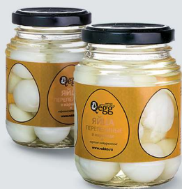
ЯЙЦО ПЕРЕПЕЛИНОЕ В МАРИНАДЕ (БАНКА) QUAIL EGG IN THE MARINADE (JAR)

Срок годности и условия хранения: при температуре от 0°C до +6°C и относительной влажности воздуха не выше 75-80% не более 30 суток.