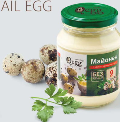
МАЙОНЕЗ КЛАССИЧЕСКИЙ БЕЗ КОНСЕРВАНТОВ И ДОБАВОК MAYONNAISE CLASSIC WITHOUT ADDITIVES

Shelf life and storage conditions: at temperatures from 0°C to +6°C and relative humidity no more than 75-80% no more than 20 days.