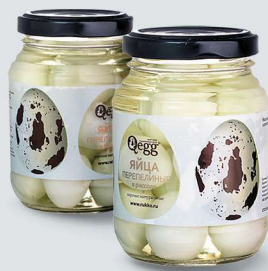
ЯЙЦО ПЕРЕПЕЛИНОЕ В РАССОЛЕ (БАНКА) QUAIL EGG IN BRINE (JAR)

Shelf life and storage conditions: at temperatures from 0°C to +6°C and relative humidity not more than 75-80% not more than 30 days.