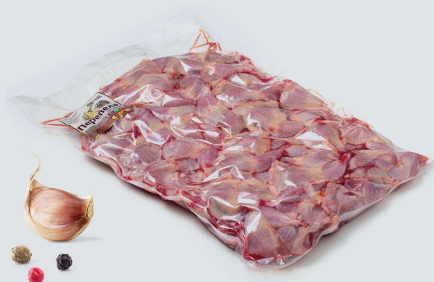
ЧЕТВЕРТИНА (ЗАДНЯЯ). ПОЛУФАБРИКАТЫ ИЗ МЯСА ПЕРЕПЕЛОВ 2,5 КГ QUAIL LEG 2.5 KG

Shelf life and storage conditions: Freezing. At a temperature of -18°C no more 12 months.